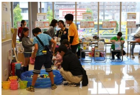
図2：ワークショップの様子