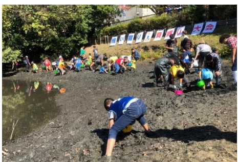
図3：会場内の様子（大学花岡キャンパス会場）