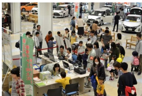
図1：会場内の様子（アリオ八尾会場）

来場者の方には、八尾の文化、歴史や環境にまつわるさまざまな体験型ワークショップ（図2）や展示（図4）によって楽しく環境について学んでいただくことができました。