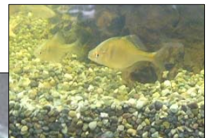
↑ニッポン バラタナゴ