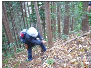
↓ 高安山自然再生定期活動