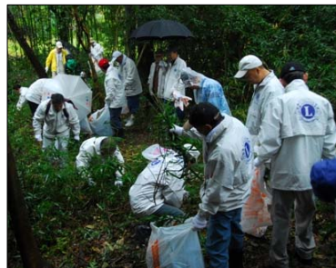
↑ 昨年の高安山クリーン作戦

「緑と水、そして史跡の街やおの原風景、原体験の再生」と云う共通の目標を持って「ゲンジボタル、オオムラサキ、ニッポンバラタナゴの里づくり」「子どもや市民の為の環境教育拠点づくり」「八尾の寺々（108ヶ寺）に美しい花を咲かせる運動」「KESならぬYESを八尾の企業に根づかせる運動」「史跡めぐり、エコハイキングコースの整備とクリーン作戦」「里池や水辺のクリーン作戦と整備」等のプロジェクトに多くの市民・市民団体・事業者・ライオンズクラブ等奉仕団体・教育機関・行政のネットワークを結集して、アクションを起こし継続して着実に再生させて行ける年にしようではありませんか。