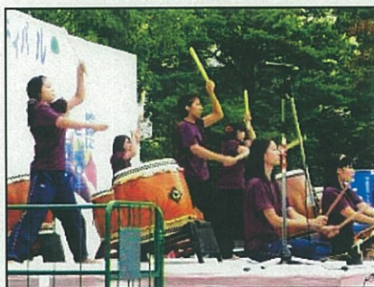
迫力ある和太鼓演奏