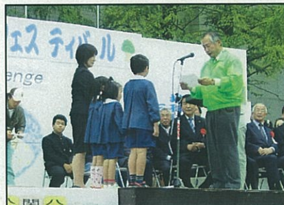
環境配慮の取り組み表彰