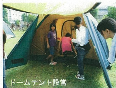
ドームテント設営