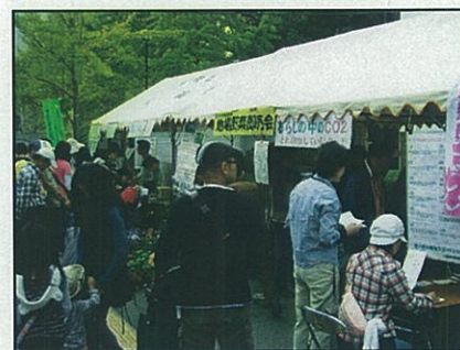
賑わう出展ブース