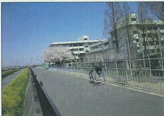
治水緑地、恩智川など豊かな自然がいっぱい