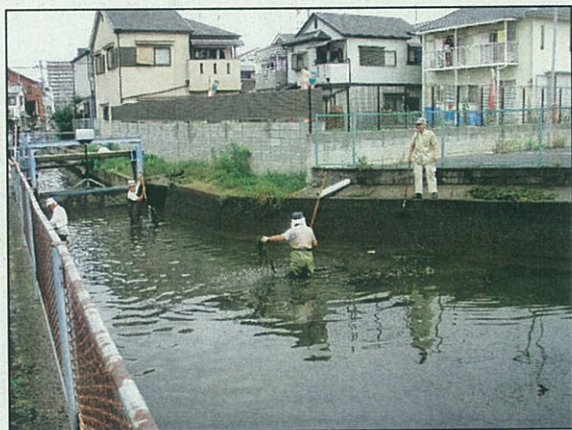
七夕感謝祭：平野川クリーン作戦 藻狩り (柏原市古町 大和川取水口付近)

*アクアフレンズは子どもたちが水と触れ合える理想的な水辺環境を目指して活動をしています*