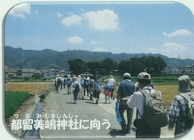
つるみしまじんじや 都留美嶋神社に向う