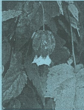
花言葉 「憶測」 誕生花 1月18日

和名はウキツリボクですが、山小屋を灯す明かりのようなイメージで流通名はチロリアンランプと言われています。