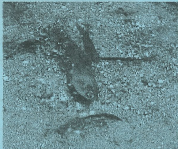
NPO 法人 ニッポンバラタナゴ高安研究会 ホームページより