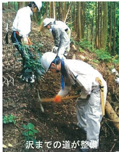
沢までの道が整備

5年目に突入！ 高安山自然再生定期活動 この1年は沢へ向かう道づくりを新たに行い、ほぼ道が整いました。道が整ったことで、森林整備がしやすくなりました。