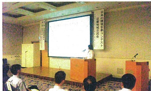
当日は会場が満席でした(来場者約 150 人)

日本の環境首都コンテストで毎年 10 位以内に入賞している、尼崎市と宇部市の両市長が「持続可能な地域社会を目指して」をテーマに公開対談されました。