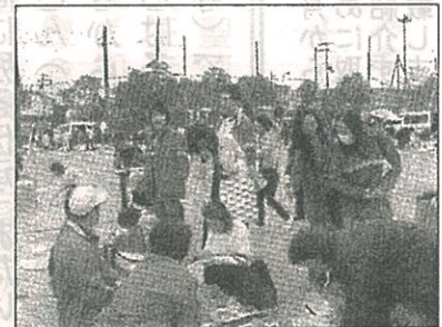
輪投げやストラックアウトもありました