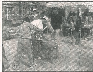
子ども達の笑顔があふれていました