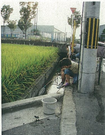
水路でザリガニ取りをする子どもたち（都塚外環状付近）

町の中のオアシスとしての役割を田んぼや畑、川や水路が担ってくれていると実感するのは、このような光景に出会ったときや、吹き抜ける風の心地良さを感じる時です。