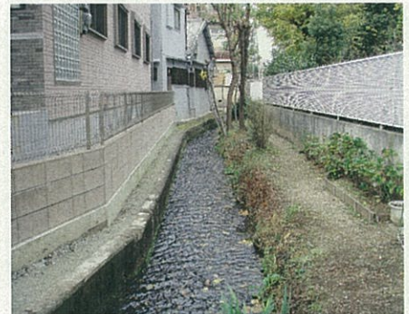
シジミやタニシを見かける水路 本町（慈願寺付近）