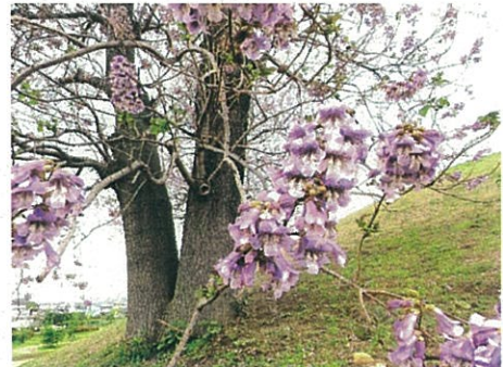
心合寺山古墳のキリの花

この1年は山菜料理、地図の見方、自然観察ハイキングなどで高安山の森林の仕組みや森の働きなどを学びました。