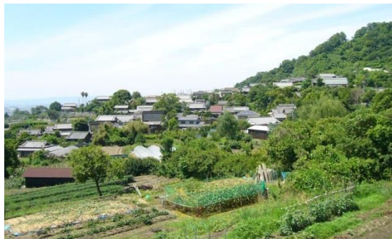
▲ 高安山神立の風景