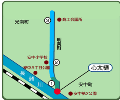
▼成法せせらぎの小径