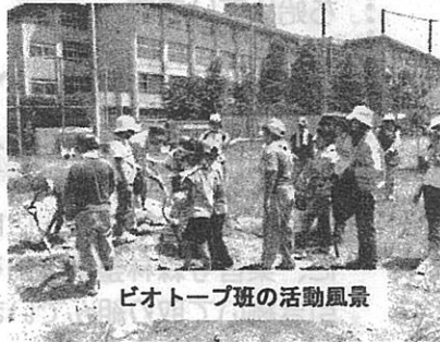
ビオトープ班の活動風景