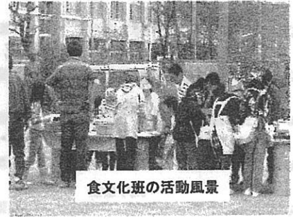
食文化班の活動風景

内容は、学校ビオトープづくり班と八尾の食文化班に分かれて別々に体験活動を行い、その後昼食を一緒にいただきながら交流するという企画です。これまで、ビオトープ班では植樹、池や水路作り、井戸掘り体験、食文化班ではビオトープで採れたジャガイモ、サツマイモ、モモ、イチゴなどを使った料理体験を行いました。