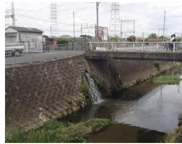
◀ 恩智川 八尾翠翔高校付近