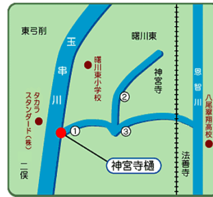
▲ 神宮寺樋の位置図