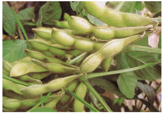
八尾の特産「えだまめ」

2011年に始まった八尾バルも今回で9回目を迎え、夏の枝豆、春の若ごぼうが美味しくなる季節の定番イベントとして、皆さんに応援いただけてきました。