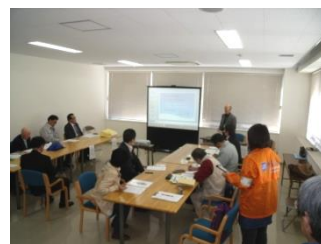
昨年度の秋季環境講座の様子