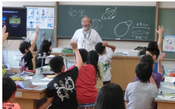
▲ 中高安小学校での授業風景

かつての高安地域は農業が盛んで“ため池”がたくさんあり、水をきれいに保つための「ドビ流し」（ため池を大掃除する作業）が定期的に行われていましたが、農業の衰退という人間の生活の変化によって濁ったままのため池が増え、ニッポンバラタナゴが絶滅の危機に瀕しました。