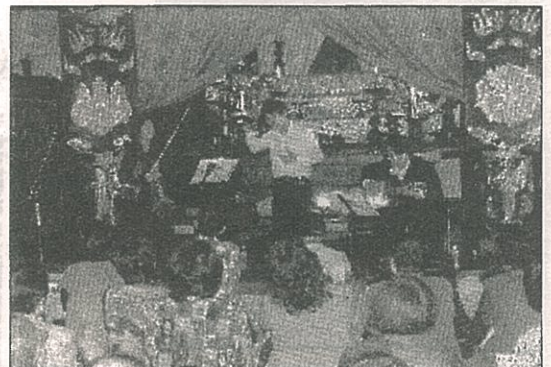
昨年の楽しい環境活動月間 第1回 環境音楽会

11月 楽しい環境活動月間 市内随所 現在行っている取り組みに、体験参加できるイベントを開催する予定です。