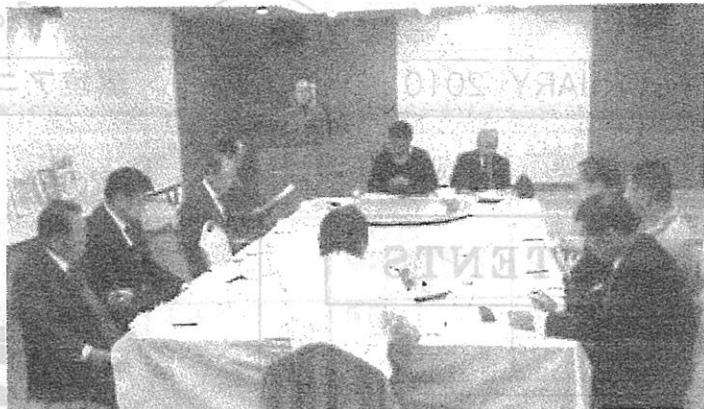
▲ 12月5日(土)「KES・サロン」初会合を開催 (西武百貨店パンケットルームにて)

環境マネジメントシステムには国際規格ISO14001がありますが、中小企業には人・物・金等経営資源の問題により取得が困難であることから、より分かりやすく取り組みやすい規格として誕生したのが KES です。