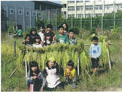
稲を刈って干してもらいました