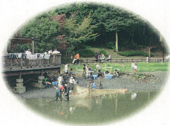
な、なんと 20,000 匹も！ ふれあい池のニッポンバラタナゴ