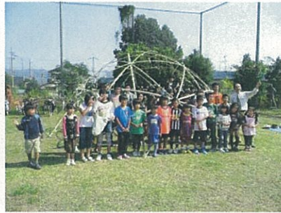
スター★ドームとは、竹を結び合わせて半球(ドーム)状にしたものです