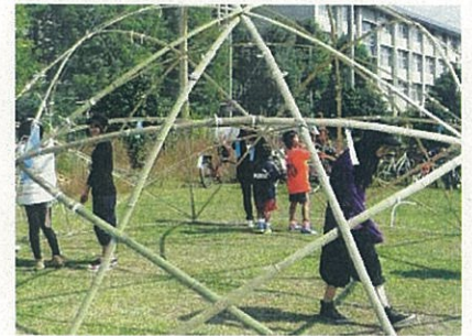
スター★ドームに願い事を書いた短冊を結びました