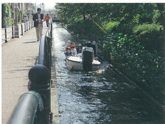
ボート乗船体験：長瀬川（安中町5丁目公園）