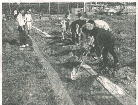
八尾北高校のリーダーシップと多様な協力で、 第2グラウンドが見ちがえるようになりました。