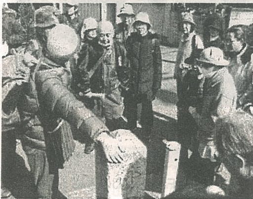
2期目がスタートしました！