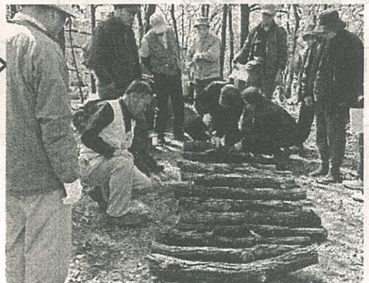
3期目に突入しました！