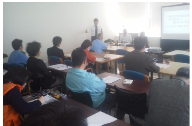
▲熱心に話を聞くセミナーの参加者たち

熱心な事業所や企業が参加され、会場は満席状態になりました。また、事業所の先進事例発表などや、今回の改訂に取り込まれるISO26000の基準となるCSR（社会的貢献）、名古屋議定書の生物多様性などの説明に、質疑応答等活発なセミナーに