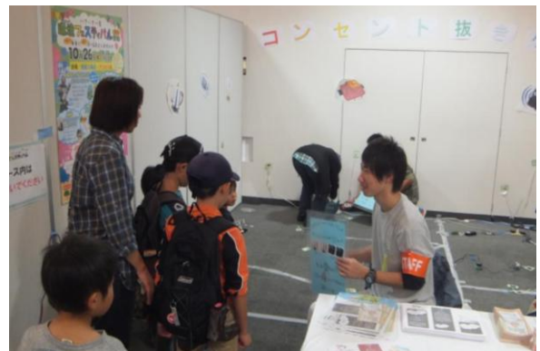
▲コンセント抜きゲームを企画し、参加者に節電を考えていただきました。

善するのはもちろんですが、議論のなかでなくなってしまう案や大人たちと話した際に出た案に対して、より詳しく丁寧に検討し形づくりたいと思います。