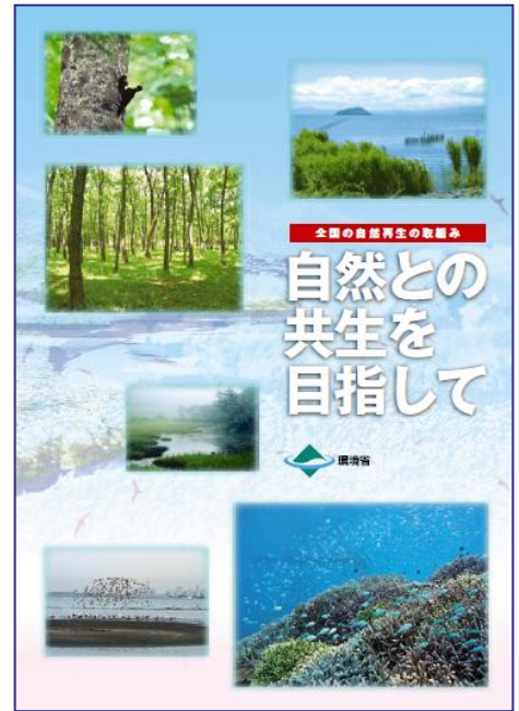
▲環境省『自然との共生を目指して』で全国の自然再生協議会を紹介