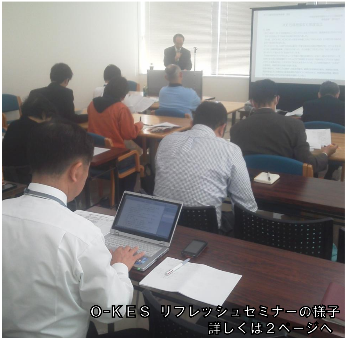
O-KES リフレッシュセミナーの様子 詳しくは2ページへ