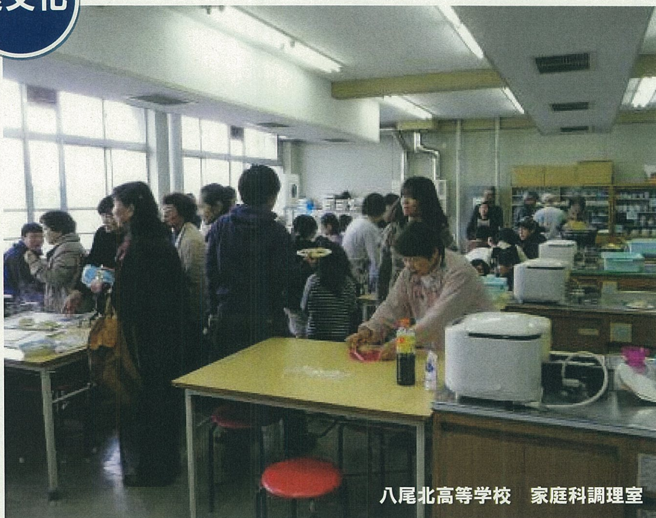
八尾北高等学校 家庭科調理室

3月17日(土)、この日は雨が降ったりやんだりの天候でしたが、通算第14回目の「学校ビオトープづくり&八尾の食文化体験交流会」を約50名の方々の参加のもとで、また、「防災講習会」を約20名の方々の参加のもとで実施することができました。