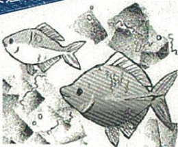
ニッポンバラタナゴ