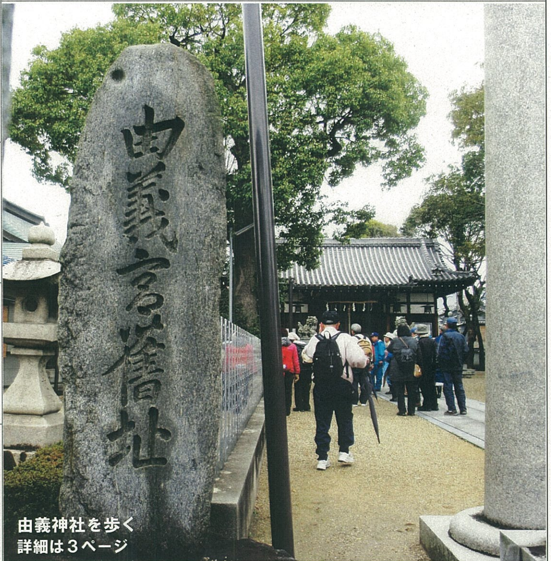
由義神社を歩く 詳細は3ページ