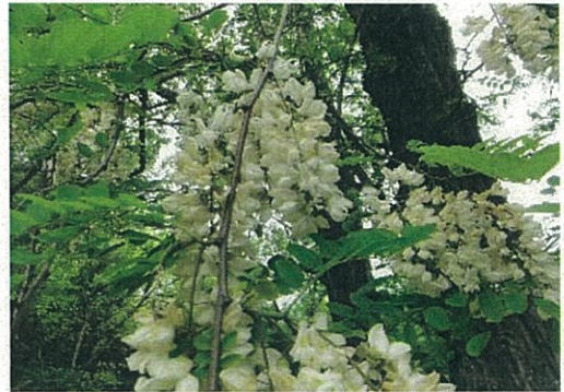
ハリエンジュの花