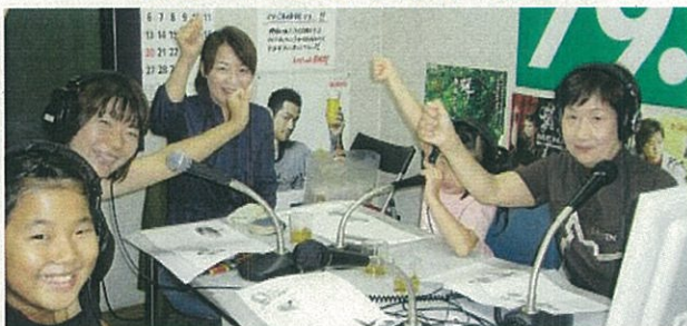
子どもたちに朗読してもらう企画もしています