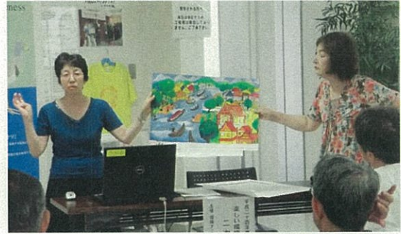
二次選考会の様子