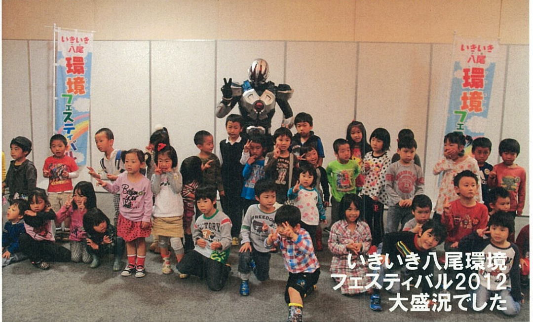
いきいき八尾環境フェスティバル2012 大盛況でした