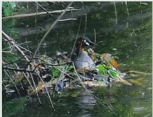
営巣中のカイツブリ