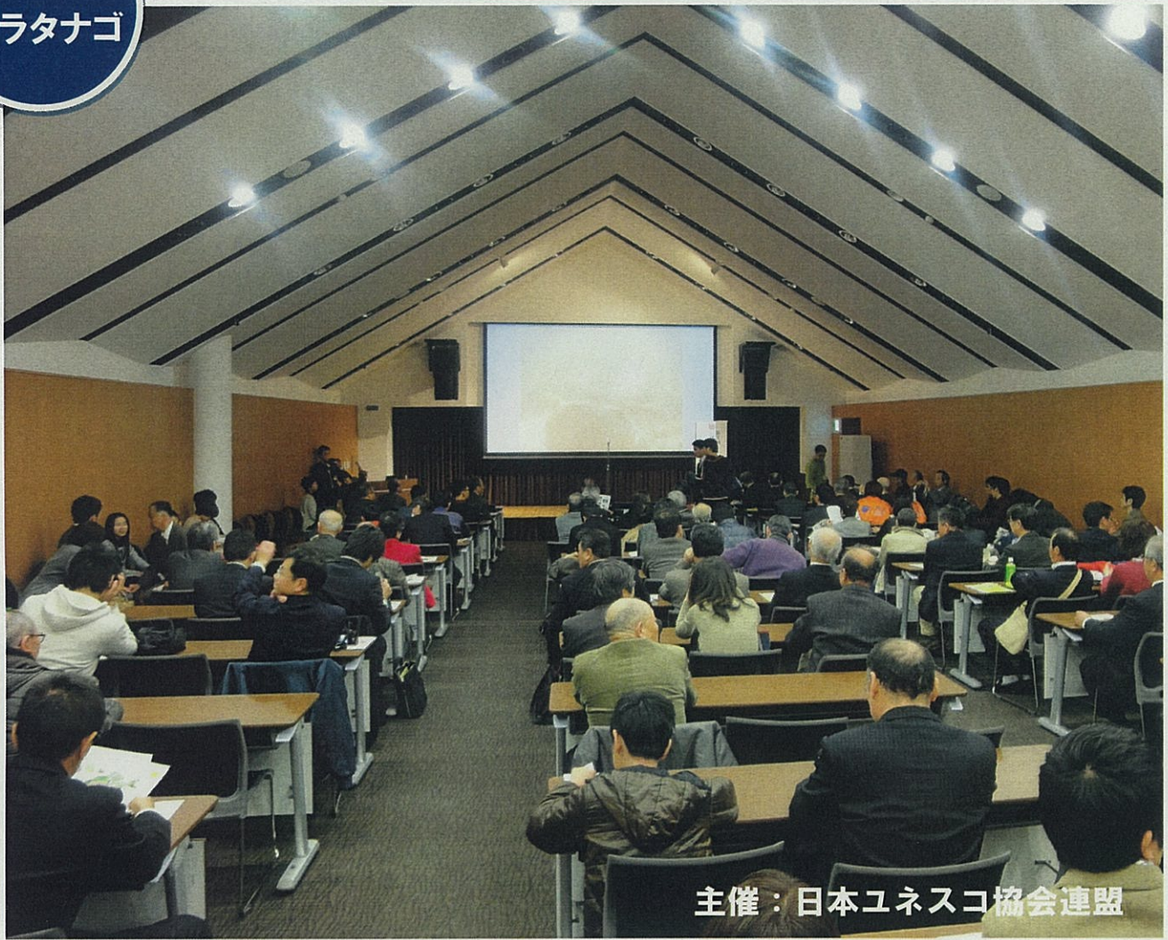
主催：日本ユネスコ協会連盟