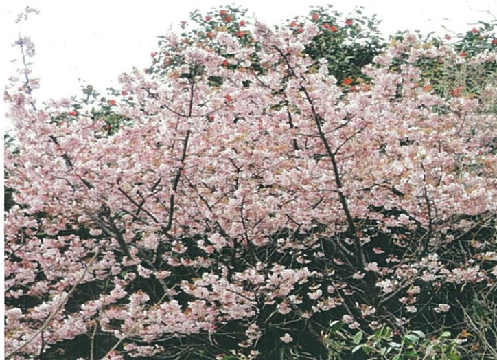
こうだち 神立の山麓や あたごづか 愛宕塚古墳付近に見られる