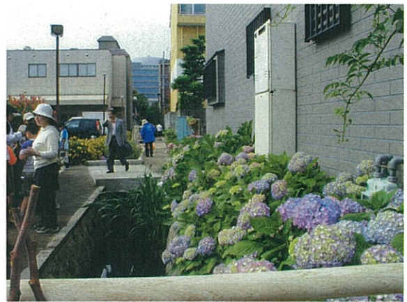
成法せせらぎの小径