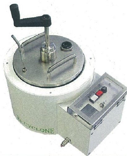
半田再生機リサイクロン(自社製品) 酸化した半田ドロス(カス)を再生して 再利用することが出来る装置です。

この業界の技術革新は目覚ましい速度で動いており、我社も乗り遅れることなく、最新の商品、最新の技術、最新の情報を顧客にお届けするよう日々努めています。