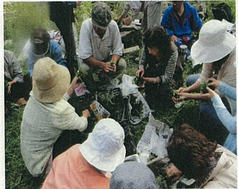
昨年の苔玉作りの様子

糸は綿100%のものを使用すると自然に無くなり、透明の釣り糸は目立たず、しっかり巻けるのでこれもおすすめです。できた苔玉を水に約5分浸けて、しみこませたら、しっかり水を切ります。