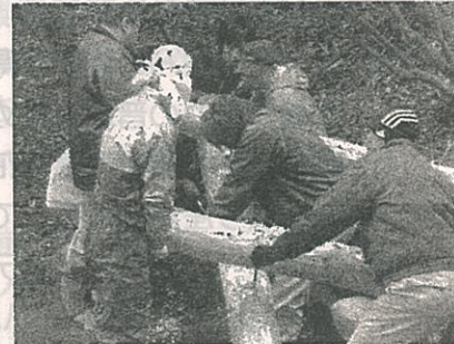
丸太を組み合わせて囲い を作っています

URL http://www.eco-ani-yao.org/ E-mail eco_ani_yao@hotmail.com