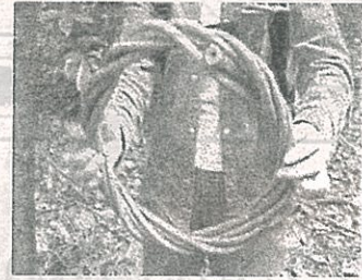
ツルで作ったリース