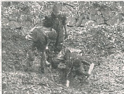
高校生もスコップでヘドロを 汲み上げています