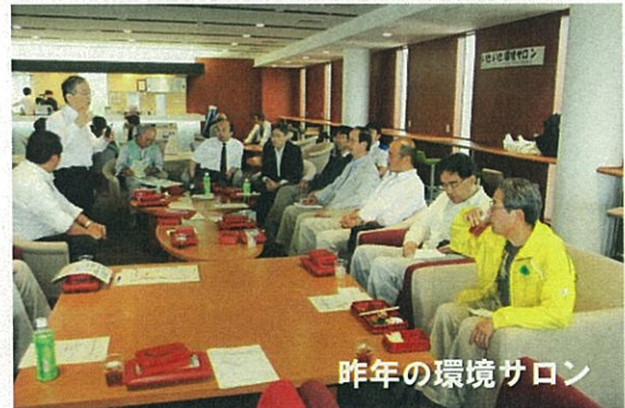
昨年の環境サロン

企業環境サロンでは、環境保全と企業経営をめぐる経験交流を主要なテーマにして、環境保全の技術や商品開発、KES取得の有効性などについてサロン風に交流したいと考えます。