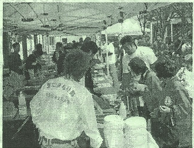
どれにしようかな?どれもおいしそう!