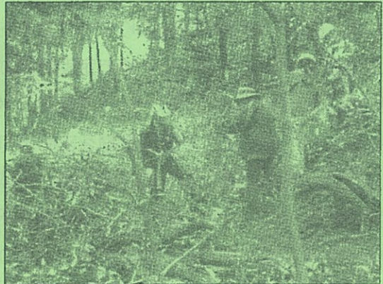
実際にやりながら学ぶ体験講座です!

☆ 講座修了者には、修了証書をお渡しします (全12回の講座のうち9回以上出席の方)。