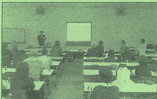
皆さんの前で、今年の活動を発表しました。