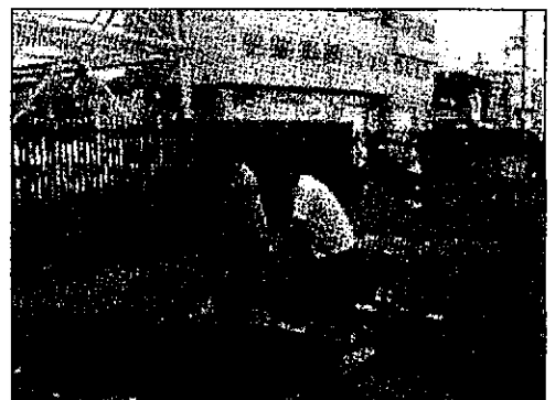
活動している生徒たち