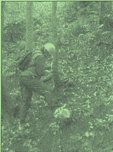
楽しいノコギリでの間伐