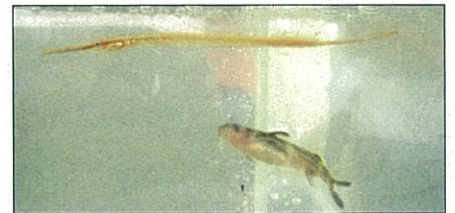
イッセンヨウジウオ（写真上） とギギ（写真下）

観察会のお手伝いをしてくださった大和川 釣り人クラブの方たちは、大和川の魚につい てはスペシャリストで、前日から準備をして水槽 に魚を入れて見せてくださいました。