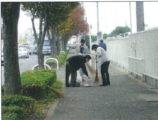
ごみのない道路に、スッキリ！