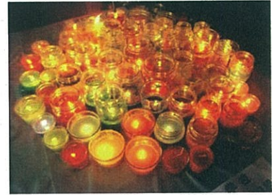
廃油から作ったキャンドル