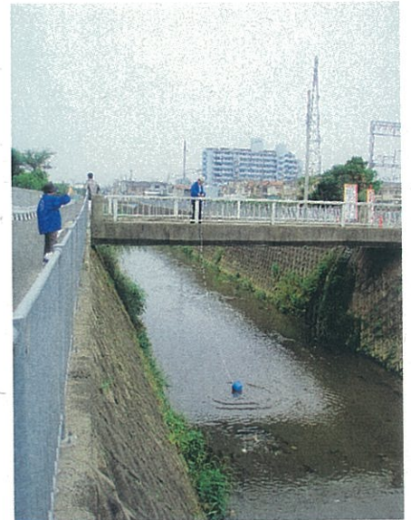
水質調査 採水：大阪府立翠翔高校前

2005年よりアクアフレンズは「身近な水環境の全国一斉調査」に参加し、6月の第1日曜日にこの地点でも水質調査をしています。この辺りから川幅はやや広くなり、水草や藻が生えてコイやカメ、トンボなどをよく見かけます。