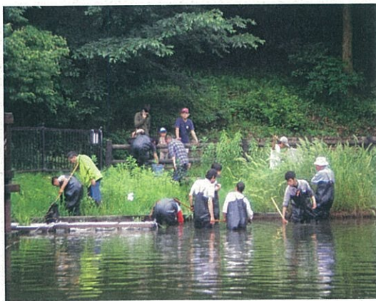
大学内の「ふれあい池」に入って観察

第2回市民環境講座 「自然再生エネルギーについて考える」岡山県真庭市における「バイオマスのまちづくり」 平成23年7月30日（土） 午後2時から4時 プリズムホール4階研修室 定員 50名