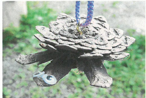
マツボックリのカメ